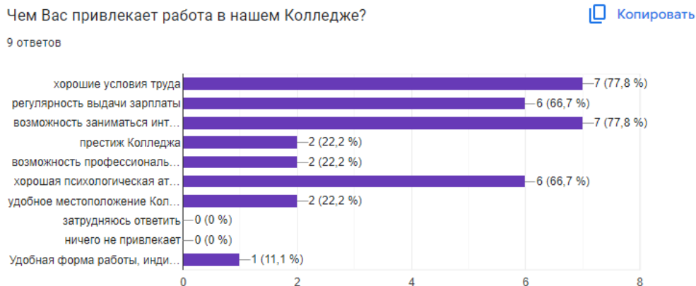
Схема 2 – Показатели привлекательности колледжа для преподавателей

В жизни Колледжа имеется много различных сторон и аспектов, которые так или иначе затрагивают каждого преподавателя и сотрудника. Преподавателям было предложено оценить, насколько они удовлетворены разными аспектами жизни Колледжа: